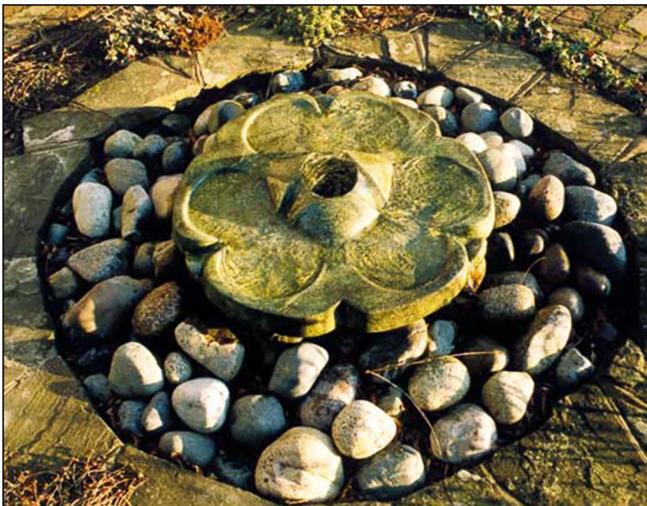
Ashdown placerad i en trädgård.

En radial symmetrisk form med tre Flowforms som svämmar över i varandra. Hela stenen blöts. Den har tre tydliga vattenfall vid utloppen som ger ett lätt porlande ljud. Ashdown kommer bäst till sin rätt om den monteras i vattenspegeln av en damm. Design av John Wilkes and Nigel Wells.