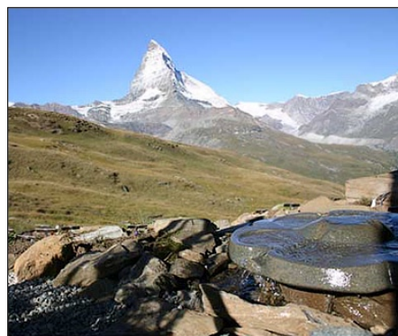
Ashdown i Alperna.