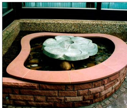
Ashdown vid en företagsentré.