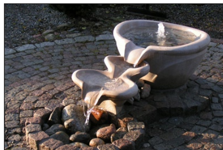
Stensund Fontän kar. Inloppsmodellen.