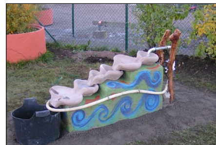
Stensund vattenlek med handpump, slangar och balja som slutkar. (fundament ingår ej)

Virbela Ateljé, Mölnbovägen 25 K, 153 32 Järna TEL: 08 551 50 335 MAIL: virbela@flowforms.se WEBB: www.flowforms.se