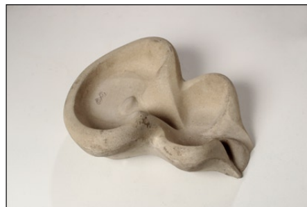
Stensund liten Flowform. Här utan hål för inlopp.