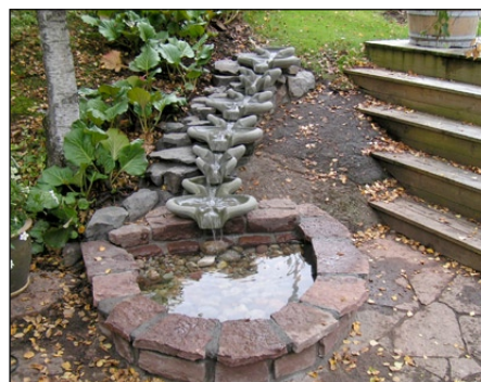
Stensund vattentrappa i privat trädgård.