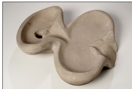
Stensund stor Flowform. Här med hål för inlopp.