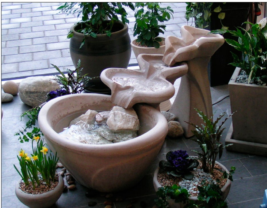
En stor Flowform som passar både inne och ute.

Stensund Flowforms är designad för ute- och inomhusmiljöer. Vattnet har ett relativt litet flöde men rör sig med en kraftig rörelse i skålarna och lämnar skulpturen i ett pendlande vattenfall som syns från långt håll. Ljudet och vattenrörelsen påminner om en porlande bäck. Stensund utgör ett spännande konstnärligt inslag i miljön som ger en meditativ, lugnande stämning. Lätt att installera.