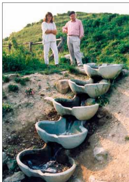
Vortex i vattenreningsanläggning.

Virbela Ateljé, Mölnbovägen 25 K, 153 32 Järna TEL: 08 551 50 335 MAIL: virbela@flowforms.se WEBB: www.flowforms.se