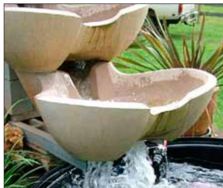
Vortex tar 150 till 300 liter per minut.