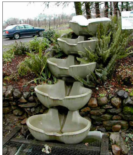
En liten anläggning i Tyskland.